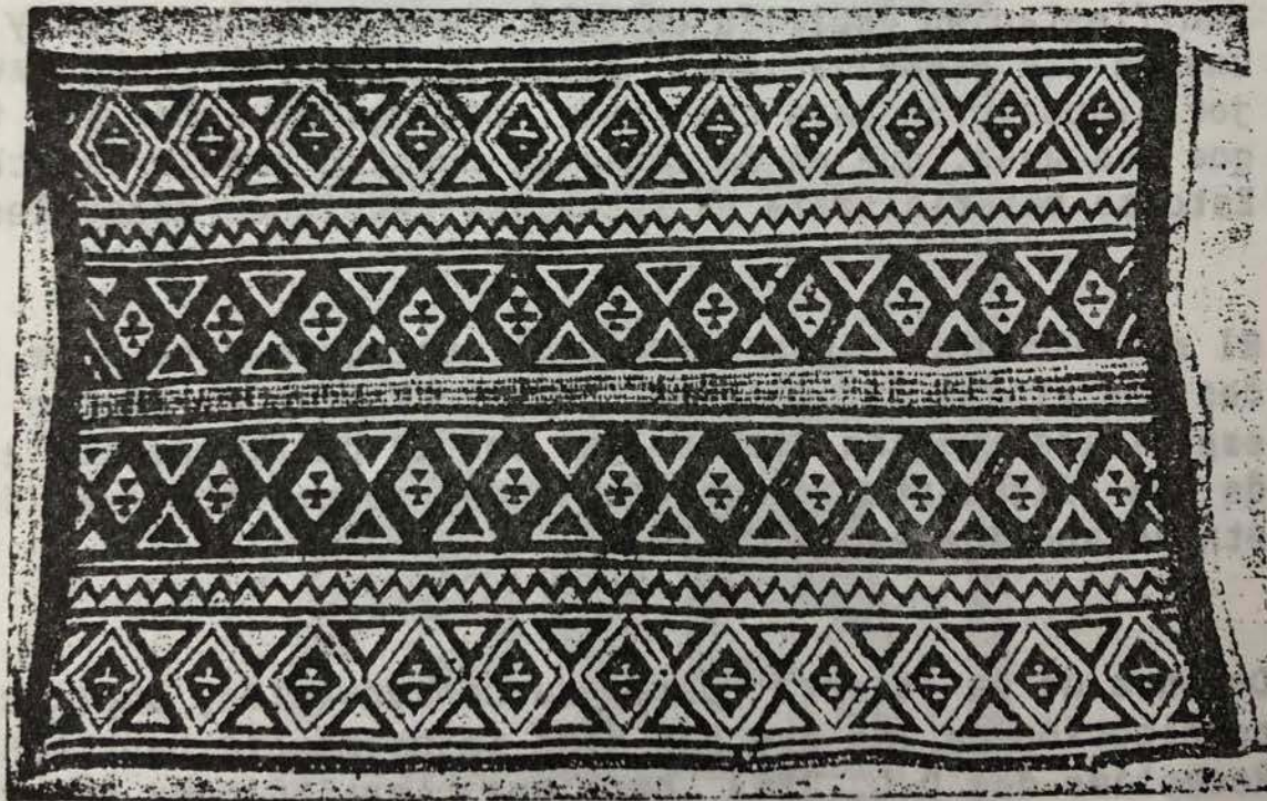
Lana de cuatro fajas de combinaciones romboidales, triángulos opuestos por el vértice cruces y líneas quebradas